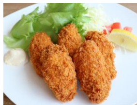
カキフライ5個まで